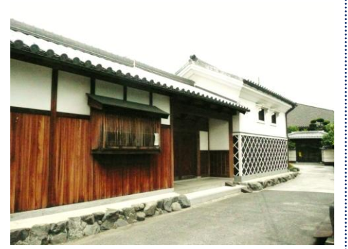
③吉川家住宅（非公開・要予約 お問合せ・市役所 072-366-0011）