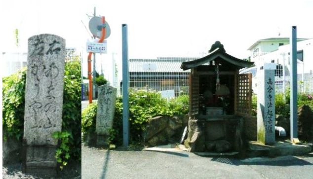
②天野海道と西高野街道の分岐の道標